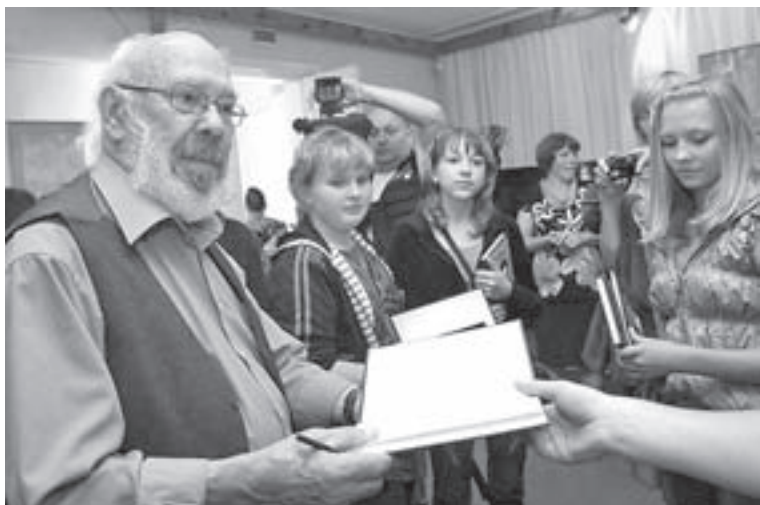
Встреча с посетителями выставки.

девочка с большими синими глазами, играла в куклы. Это сестра Ваньки — Наташка...» Дети в рассказе очень светло живут! Хотя и доходит дело до драки — из-за бабок.