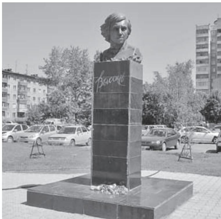
Памятник В. С. Высоцкому в г. Барнауле (ул. Молодёжная, 55). Автор — Н. В. Звонков.

«Молодёжь Алтая», 23 января 1987 г. Журнал «Барнаул», № 2, 2002 г.