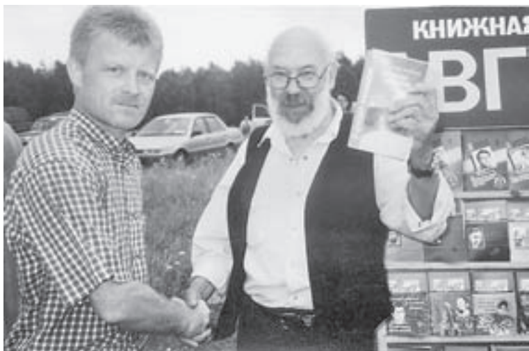
Пикет. Шукшинские чтения, 2002 г.

пьютерные технологии бездушны. Я люблю технику, но славлю будущее, в котором чистое творение рук человеческих не исчезнет.