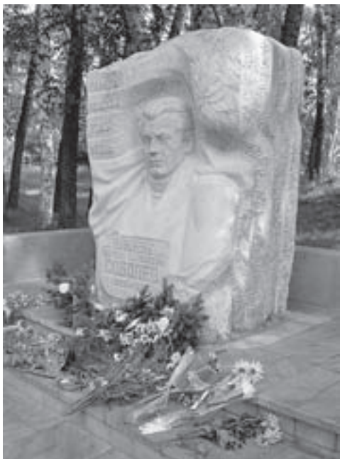
Памятник А. П. Соболеву в р. ц. Смоленское на Аллее Победы.

с приветственными словами обратились губернатор Алтайского края Александр Карлин и министр культуры РФ Александр Соколов. Министр предложил почтить минутой молчания память скульптора Вячеслава Клыкова, чей памятник Шукшину установлен на горе. Затем на сцене в течение двух часов под палящим солнцем звучали стихи и песни, выступили известные писатели, актёры и режиссёры.