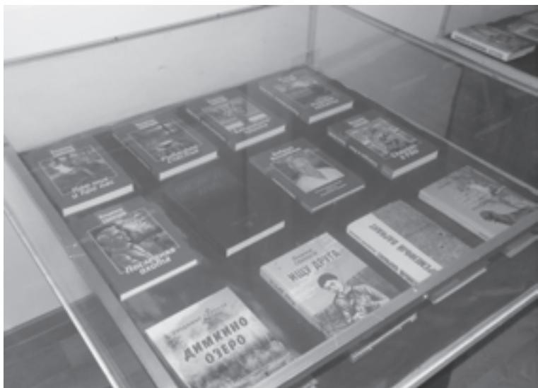
Фрагмент книжной экспозиции выставки в ГМИЛИКА, посвящённой жизни и творчеству В. Б. Свинцова.