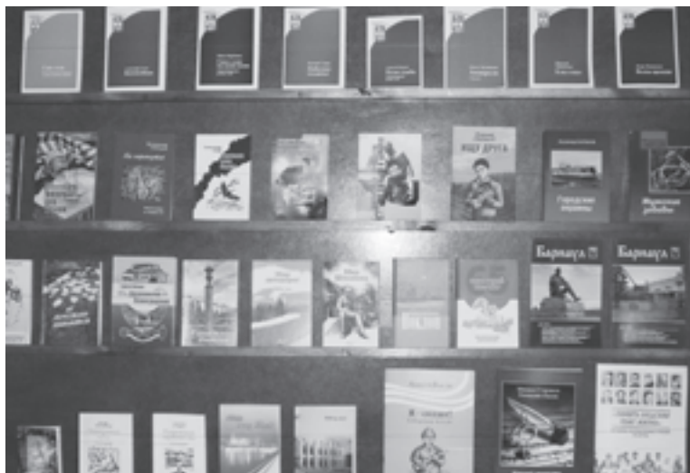
Стенд с книгами писателей Алтайского края. Барнаул, ул. Анатолия, 102, Дом писателя (холл второго этажа).

Любовь Василия Шукшина к Алтаю взаимная. В этом году 28-й раз мы собираемся на горе Пикет, чтобы торжественно почтить память нашего земляка. Немногие из современных писателей России так овладели умами и сердцами простых людей, как он. Непреходящая любовь собирает в село Сростки тысячи поклонников Шукшина.