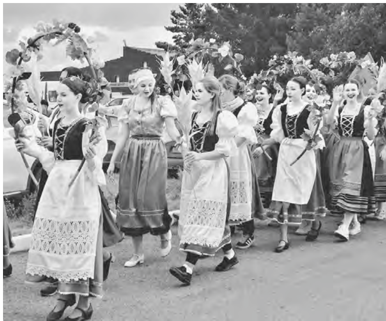
Der Festzug der Delegationen in bunten deutschen Nationaltrachten.

Zum Fest wurde ein reichhaltiges ethnokulturelles Programm vorbereitet, das dem Hauptthema des Sommerfestes dieses Jahres, und zwar, „Kleine Heimat“, gewidmet war. Die Feier begann mit einem Festzug aller Mannschaften in bunten deutschen Nationaltrachten und der feierlichen Eröffnung, in