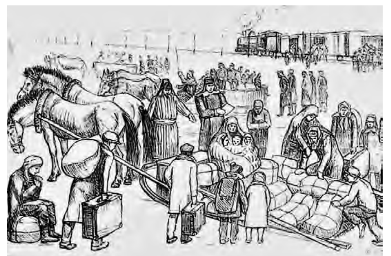
Fragment des Gemäldes von Günther Hummel „Die Ankunft der Aussiedler an der Station Predgornoje der Region Ostkasachstan. November 1941.“

Und hab' ich mein irdisches Werk vollbracht,