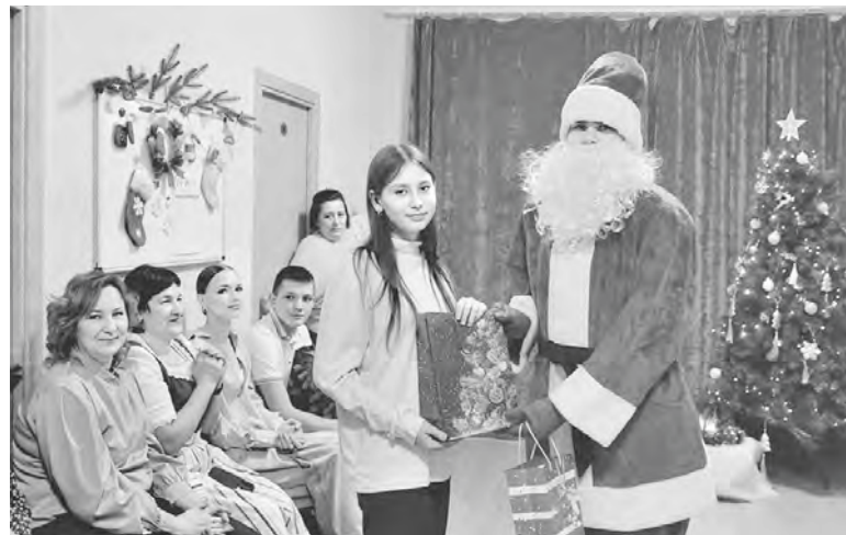
Das Fest mit Geschenken rundete die Familientreffen ab.

Das deutsche Kulturzentrum Kulunda aus dem gleichnamigen Rayon pflegt seit langem die Tradition, im Dezember mehrere Maßnahmen, dem Weihnachten gewidmet, für Kinder, Jugendliche und Erwachsene zu organisieren. In diesem Jahr wurden drei solche Projekte nach wie vor in Jarowoje auf der Basis des Sanatoriums „Chimik“ umgesetzt, die zuerst Kinder und Jugendliche und dann russlanddeutsche Familien der Altairegion zusammenbrachten. Jedes Mal wartete auf die Teilnehmer ein reiches Programm voller spannender Aktivitäten, dank dem sie sich in die festliche Atmosphäre vertiefen konnten.