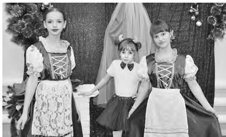
Junge Talente aus dem Deutschen Zentrum „Veilchen“, Nikolajewka.

Die Nominierung „Theatralisierte Lesungen“ sah die theatralisierte Deklamation der Gedichte der vorgeschlagenen russlanddeutschen Autoren-Jubilare vor. Während der Aufführung verwendeten die Beteiligten musikalische Begleitung, Dekorationen und Kostüme. In der Nominierung „Buch auf