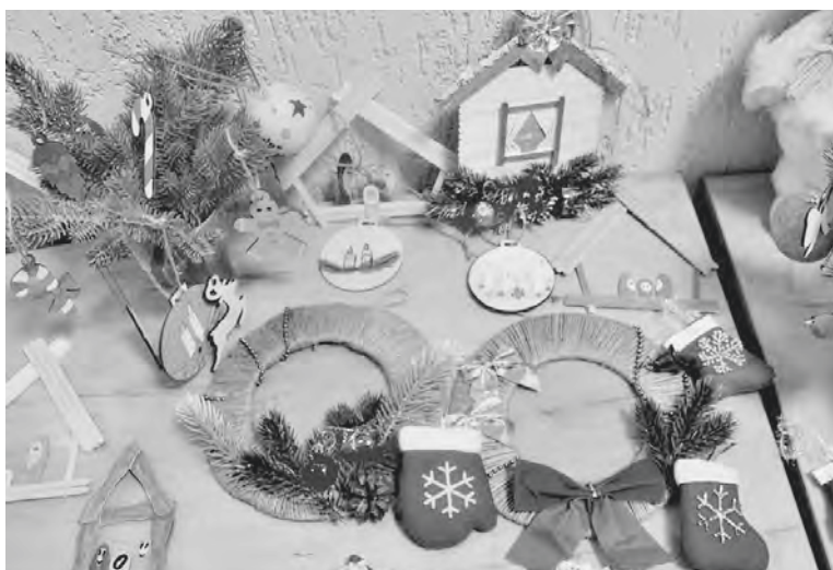
Handarbeiten von den Teilnehmern der Kinderwerkstätte.

ßerdem lernten die Vertreter der älteren Generation die wichtigsten historischen Ereignisse im Leben der Russlanddeutschen kennen und sahen sich Dokumentarfilme über das Schicksal der deutschen Volksgruppe an. Noch mehrere andere Aktivitäten fanden im Laufe der Familientreffen statt. Ein spannendes Spiel „Finanzielle Abenteuer“ enthüllte beispielsweise die Geheimnisse der Finanzkompetenz und das Kino-Quiz war den Filmen, wo russlanddeutsche Schauspieler spielten, gewidmet.