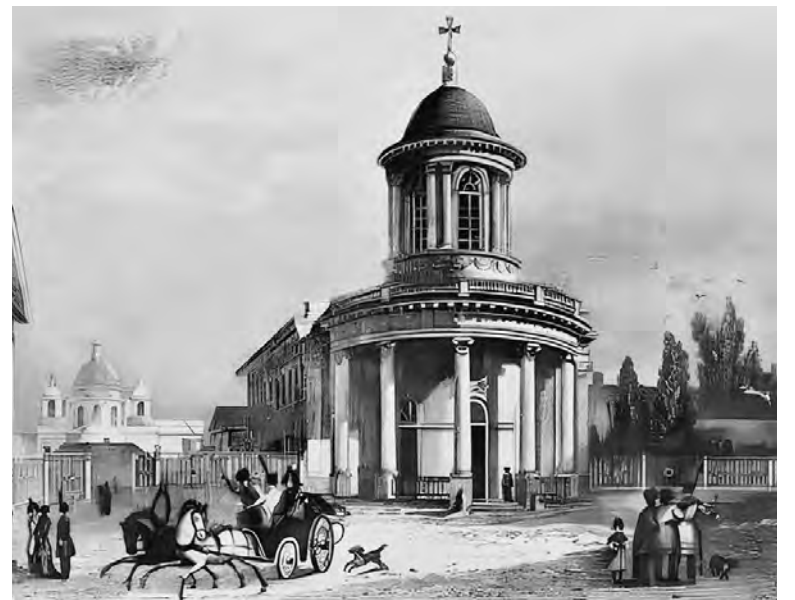
Die evangelisch-lutherische Annen-Kirche in Sankt Petersburg.

Das deutsche Schulwesen in Russland, das im 19. Jahrhundert mit den Bestimmungen von 1871 und 1891, die die Russifizierung von Zentralschulen und Elementarschulen verfügten, eine harte Zäsur erfahren musste, hatte bis dahin mit Schwierigkeiten existenzieller Natur zu kämpfen. Abgesehen vom Baltikum, das auch kulturpolitische Sonderrechte genoss, waren die deutschen Gemeinden in Stadt und Land auf sich selbst angewiesen. In den Manifesten der Zaren, die Deutsche ins Land riefen, war die Schulfrage nicht festgelegt, folglich war sie für den russischen Staat nicht existent.