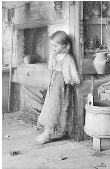
Fragment des Bildes „Mädchen mit den Kätzchen“ von Iwan Gorochow, 1895.

„Nein, wir vergessen es nicht!“, riefen die Kinder aus.