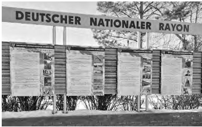
Die im Rahmen des Projekts hergestellten Infostände.

Im Zuge der Projektumsetzung wurden mehrere Ar-