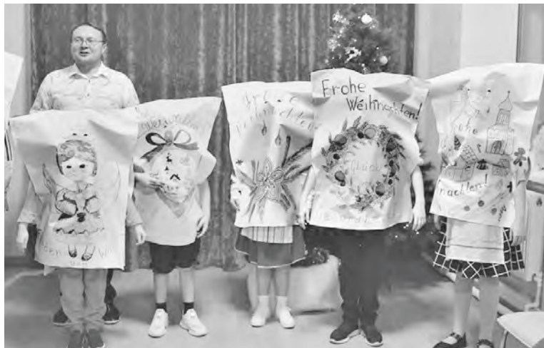
„Lebhafte“ Glückswunschkarten machten Groß und Klein Spaß.

Für die Erwachsene und Kinder wurden Sprachtreffen organisiert, die auf spielerische Weise mit Liedern und Gedichten in deutscher Sprache dargestellt wurden. Au-