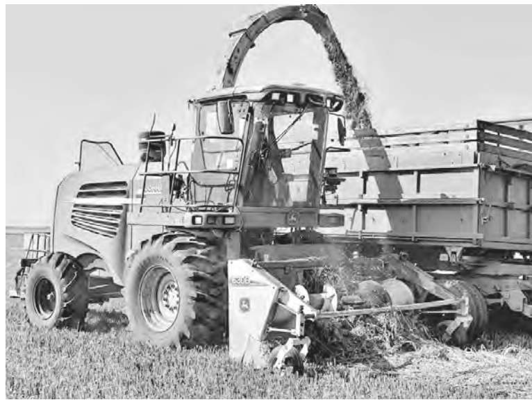
Auf den „Eco-Produkt“-Feldern bei der Beschaffung der Anwelksilage.

Die „Eco-Produkt“ GmbH gehört zu den größten und stabilsten Wirtschaften im Deutschen nationalen Rayon. Dabei ist man in diesem Betrieb überzeugt: „Erfolg jedes Unternehmens ist jedoch das Verdienst seines Kollektivs.“